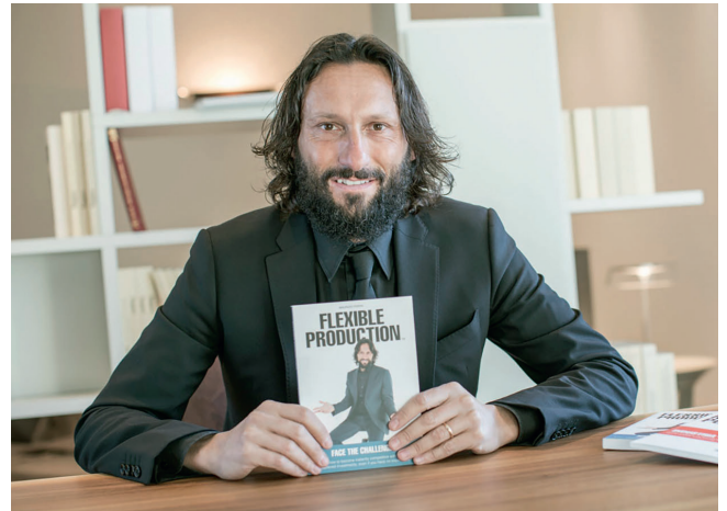
2 Gerade in Krisenzeiten sind innovative Produktionsmethoden ein Schlüssel zum Erhalt der Wettbewerbsfähigkeit

Die Herausforderung, auf die sich Covid-19 konzentriert, kann einen Bezugspunkt für einige Unterstützungsinitiativen in der Welt des verarbeitenden Gewerbes darstellen. Aus diesem Grund hat Porta Solutions eine Initiative gestartet, die Anreize für Investitionen in Technologie zu schaffen soll, um den neuen Herausforderung in einem Markt, der durch das Virus in die Knie gezwungen wurde, besser begegnen zu können.